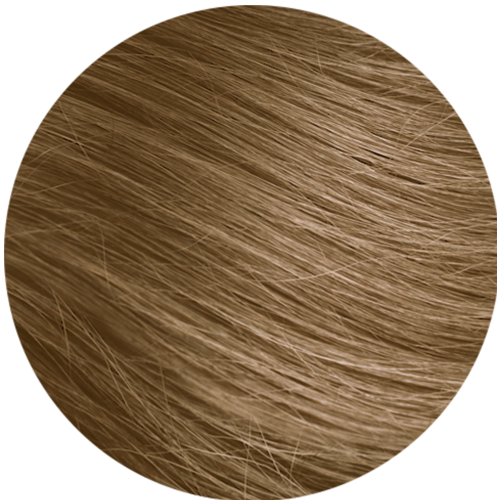
7.3 Biondo dorato