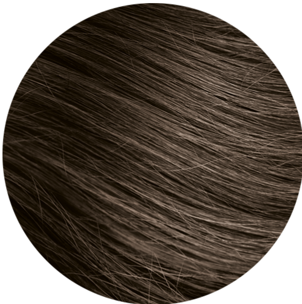
5.0 Marrone chiaro